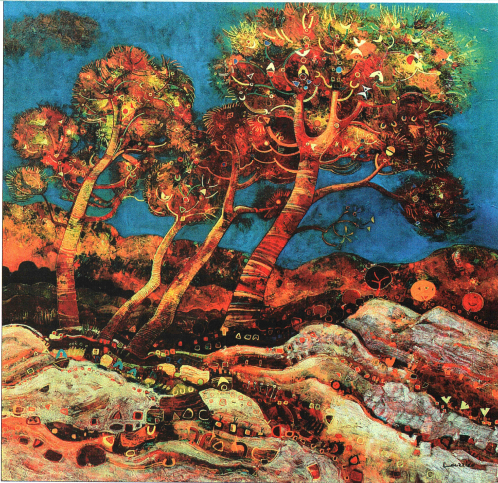
"Sous le mistral", 120 x 130 cm