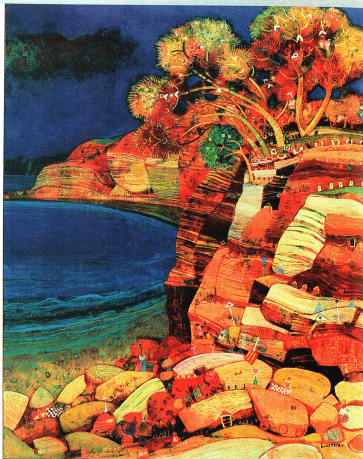
"Le falaises de Ste Barbe", 146 x 114 cm