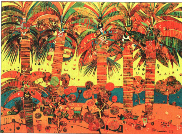
"Bord de mer en tunisie", 130x97 cm