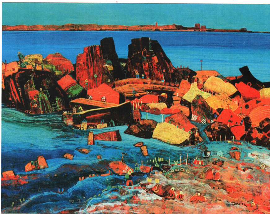
"Fort de Socoa", 146 x 114 cm

plus importants. Aujourd'hui, ayant quitté cette fonction exaltante mais accaparante, Larrieu tout en se consacrant à sa peinture continue toutefois à participer à la vie de ce salon auquel il est très attaché à juste titre.