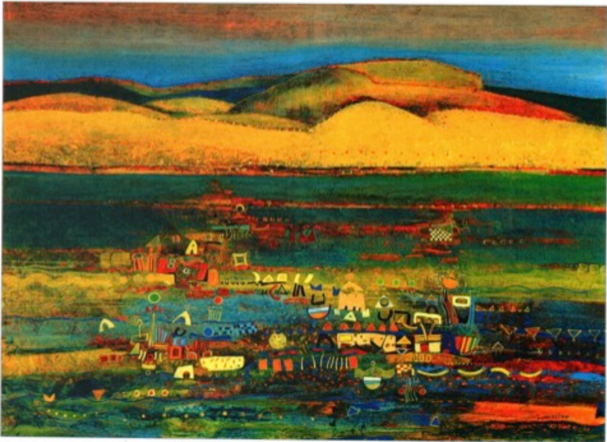
"Brume", huile sur toile, 130 x 97 cm