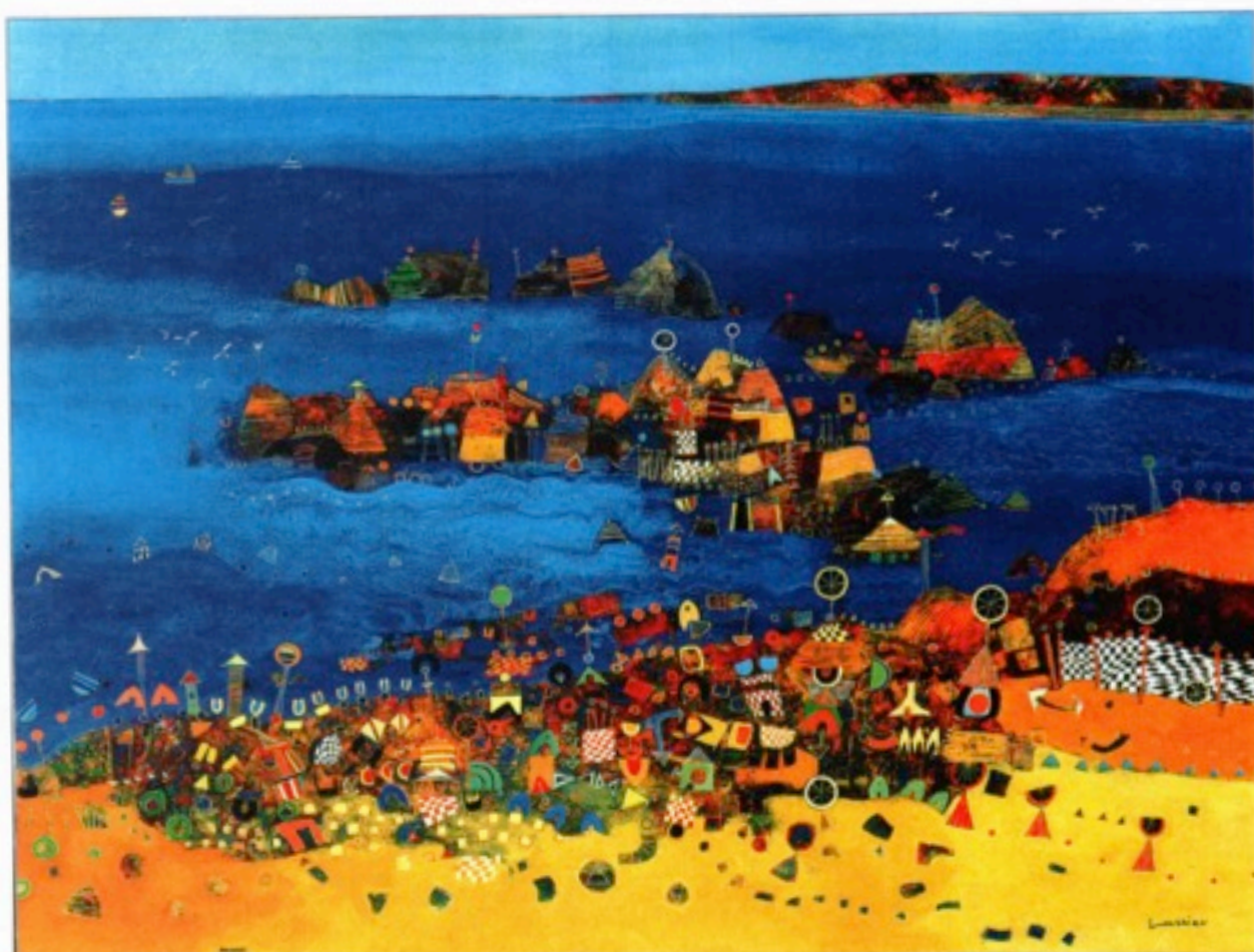
"Irlande", huile sur toile, 146 x 114 cm

avec les zones d'aplat aux rythmes musicaux. Les peintures de Larrieu ont toujours, et bien heureusement pour nous qui les regardons, ces charges émotionnelles qui nous vont droit au cœur et qui interpellent en nous les souvenirs et les images du passé. Les villes qu'il représente sont féeriques et pourraient très bien illustrer certains contes des Mille et une nuits tant elles sont les décors parfaits pour des aventures d'où la mythologie ne serait pas exclue.