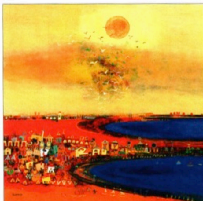
"La marée", huile sur toile, 120 x 120 cm

Alors à nous de saisir la chance d'aller vers ce peintre qui lui, prend le temps d'aller vers nous et de nous donner la possibilité de réfléchir. Et si les titres de ses tableaux sont simples, c'est pour ne pas