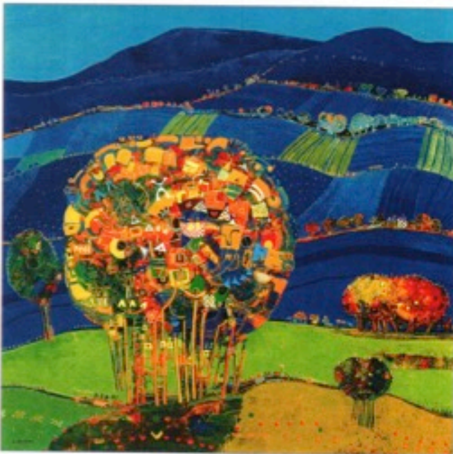
"Les Alpes", huile sur toile, 120 x 120 cm

amputer notre possibilité de rêver dans les espaces qu'il a mis en scène pour nous. Sinon, je crois qu'on y voit plus des arbres de vie, des villes inconnues et merveilleuses, des sites emplis de mystères et des villages magiques, que de simples paysages descriptifs.