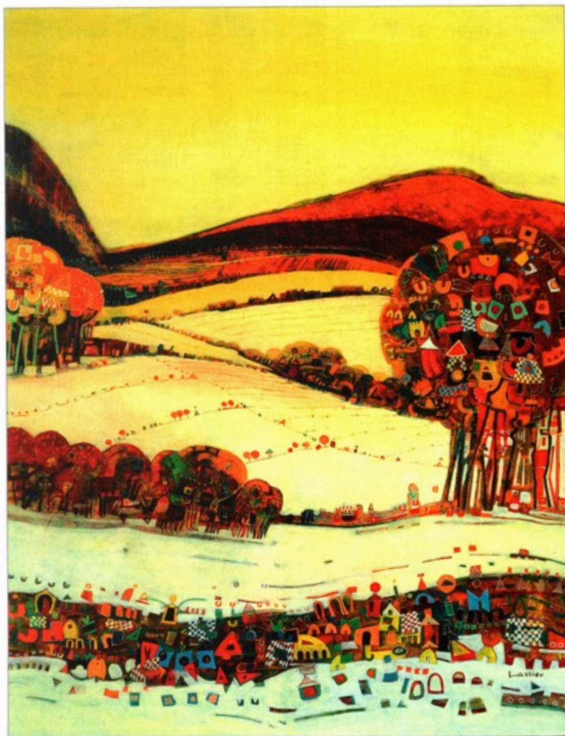
"Randonnée", huile sur toile, 97 x 130 cm